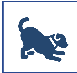
Gyvūnų sveikata ir gerovė Gyvūnų veisimas