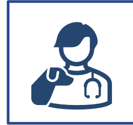
Veterinarinė medicina ir veterinarijos paslaugų teikėjai