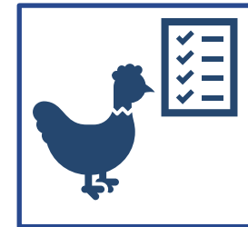
NMA ūkio subjektų vertinimas dėl kompleksinės ir susietosios paramos gavimo