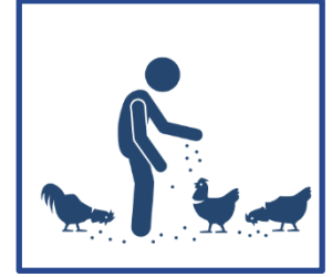
Pašarai, pašarų priedai