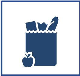
Maisto ir geriamojo vandens sauga ir kokybė